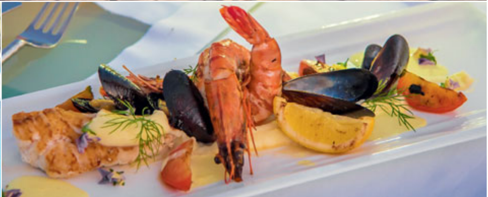
Die deutsche Schauspielerin Katja Flint kochte mit Küchenchef Christoph Pentzlin im Hideaway Beach Resort groß auf. Gemüse aus dem hoteleigenen Garten, Zahnfisch, Muscheln und Langusten standen auf dem Speiseplan.

fühl“. Viele der großzügigen Häuser verfügen auch über einen privaten Pool, aber alle haben einen fantastischen Blick auf das azurblaue Meer, das zum Schwimmen, Schnorcheln und Tauchen einlädt. Das Hausriff mit seiner farbenprächtigen Fischwelt ist nur maximal 30 Meter vom Strand entfernt. In nächster Nähe gibt es über 20 Tauchplätze, alle nur gering