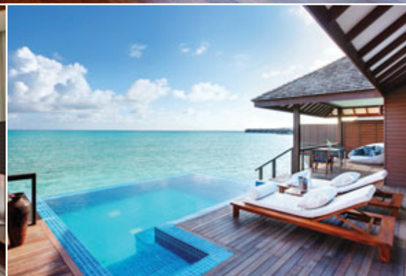
Luxus bedeutet im Hideaway Resort auch Platz, Geräumigkeit und ein enormes Maß an Intimsphäre, wie sonst kaum noch auf den Malediven.

G anz im Norden der Maledivischen Inselgruppe, rund 300 Kilometer von der Hauptstadt Malé entfernt, findet sich mit dem Hideaway Beach Resort & Spa auf der Insel Dhonakulhi eines der besten Resorts im Indischen Ozean. Der Name Hideaway ist Programm. Das Resort ist ein exklusiver Rückzugsort wie aus dem Bilderbuch. Die üppig bewachsene, sichelförmige Insel ist 1,4 Kilometer lang und fast 300.000 Quadratmeter groß, Bananen- und Kokospalmen sowie Mangroven säumen die schneeweißen Traumstrände. Kein